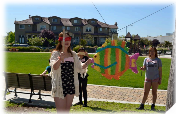
Piñatau 有很多驚 喜在魚裡面

還有打羽球及烤肉！其中最讓我印象深刻的是最後一次烤肉 老師帶了西班牙人會玩的活動 piñata