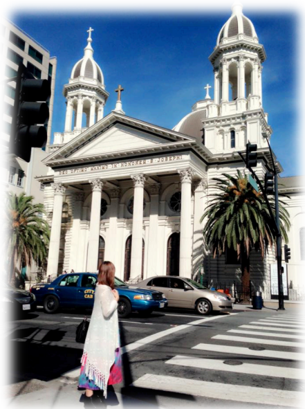
位於市中心的 聖約瑟大教堂

除了上專業課程及語言課程學習之外，在國外的生活更是一種新的自我挑戰及學習，很幸運的在旅途的過程中有一群志同道合的朋友一起陪伴我成長，而在宿舍我們我們都必須要學習一道擅長的料理是在所難免，所以有時我們都會聚集一些同學到家裡開個小派對，而我們都會各自準備一道料理讓大家品嚐，當然同學來自於不同國家亦有不同的文化，所以也能品嚐到其他國家的家鄉菜及作法，也是我們所能學習的，再來就是自行旅遊探索，激發自己的冒險精神和解決問題的能力，一到假日，我和室友都會安排到一些城市去探索像是 Sanjose downtown，我們學習自己研究如何搭輕軌到市中心，然後去拜訪的著名的聖約瑟大教堂，