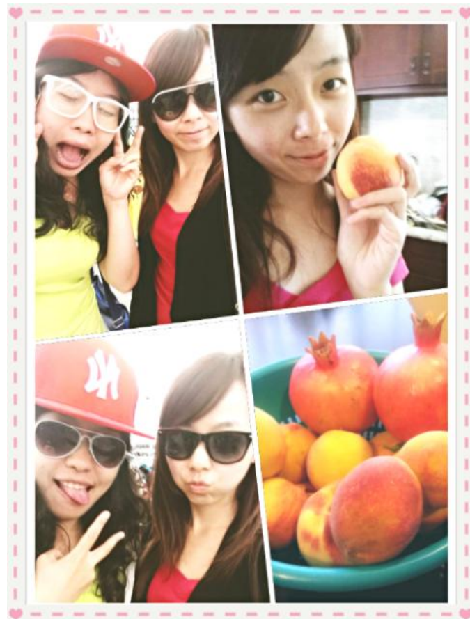
● 這些水果都是自家後院摘的優

我們和房東住在一起，房東太太人很好，住的環境很乾淨，家裡的後面種了好多果樹，房東說想吃都可以自己摘呢！在台灣好難想像自己家後花有有好多果樹呢！廚房的設備一應俱全，因為是合住，在生活習慣上要隨手把環境整理乾淨，房東隔天要上班，我們盡量都在10點前洗好澡，大家互相配合，相處得很愉快。