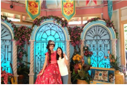
與 Elena 公主合影