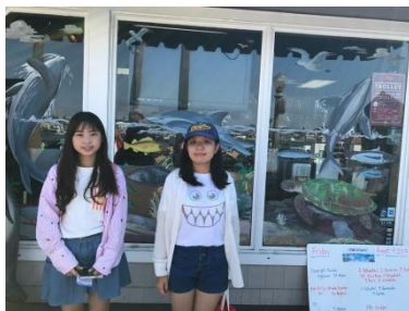
New Port Beach

第一次的坐船賞鯨/豚秀就獻給了美國，當天非常炎熱所以我們選擇搭傍晚的船班出海，約莫開了一個多小時就看到遠處有一波波的漣漪原來是可愛的海豚來了，看到牠們跟在我們身邊像是熱烈的歡迎我們的到來就覺得很興奮；雖然很可惜這個季節看不到鯨魚、但有海豚與海獅的陪伴讓我有個很特別的周末。