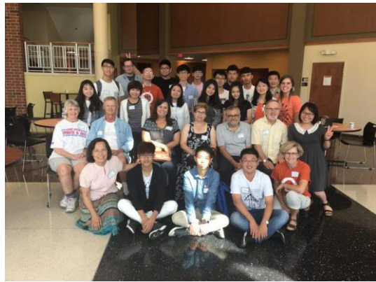
參訪印第安那與 Host family 一同出遊