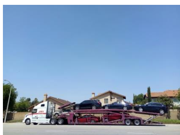
拖車司機把車子送到公司