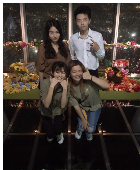
圖十一 東京晴空塔