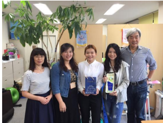
圖三 第一次與社長見面

不懂的也能自己用手機查單字和文法的意思，讓我能懂的那些說明書的意思，還說能使用那些健身器材，這樣不僅能加深我的印象，也讓我學到了不少新的單字，也親身體驗了公司的產品。