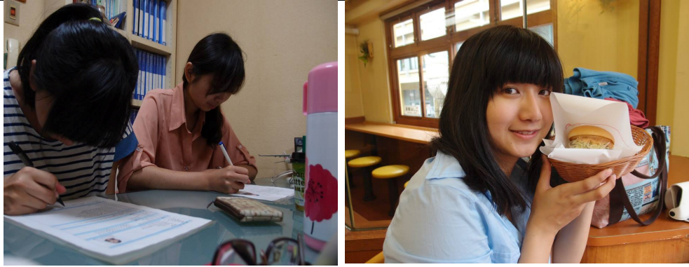
認真工作（左圖）與社長的早餐約會(右圖)