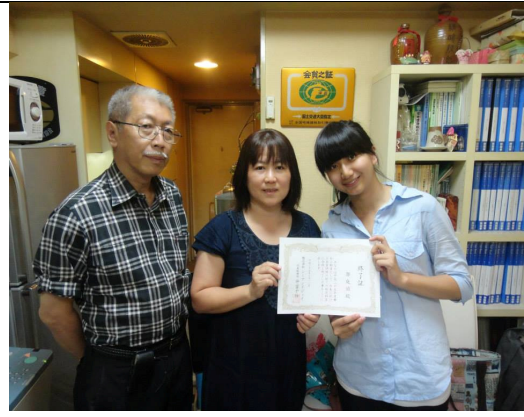
與會長社長的大合照(左上)