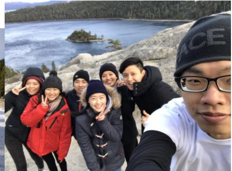
• Lake Tahoe

這是我們的跨年之旅也是我們最後的旅行，旅程結束後大家就要各自回國，雖然很捨不得但卻只能珍惜大家還相聚在一起的時光，這是一個五天四夜的行程八個人兩台車，我們去了丹麥村、環球影城、迪士尼、Santa Monica、葛利菲斯天文台、Getty Center、比佛利山莊、好萊塢星光大道。