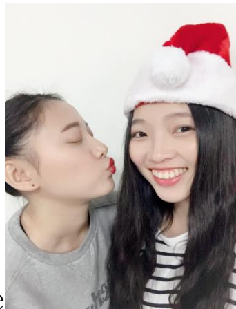
• My Roommate

覺的到自己有所成長，在溝通方面更有技巧、更圓融能清楚表達自己的想法並且不激怒對方讓對方理解我的想法，看事情的角度、處理事情的方式也和以前不同，有時候先站在對方的角度想想就能夠理解，謝謝教育部和主任給我這個機會讓我到美國學習，讓我能夠擁有這樣一個值得收藏一輩子的回憶，這四個月是我最快樂的時光。