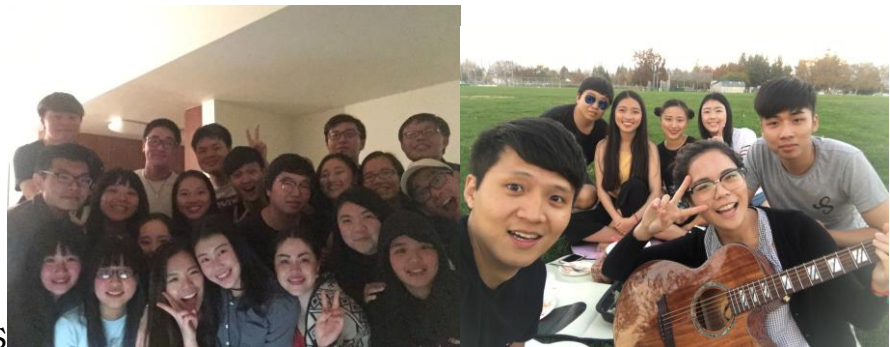
• My Friends