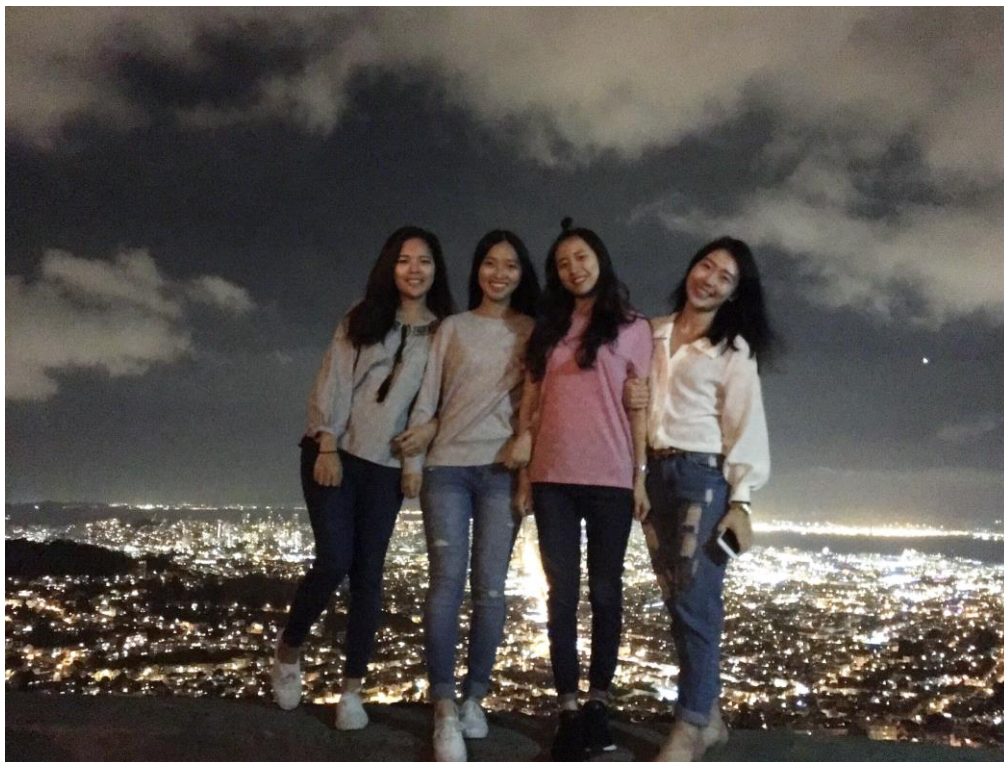
舊金山雙子峰夜景