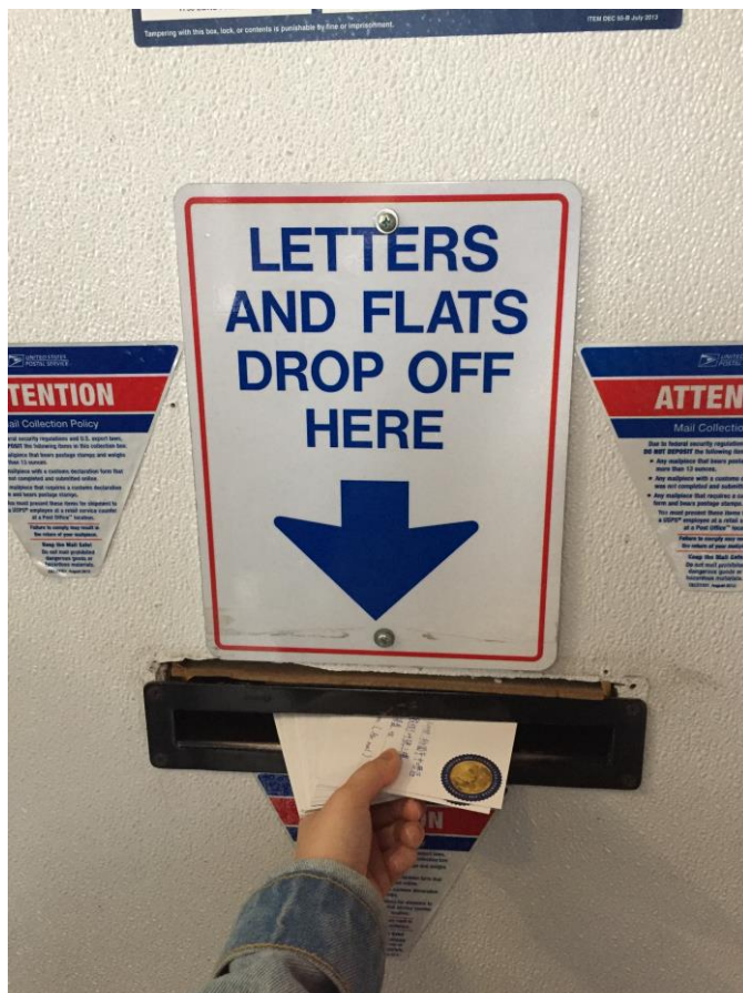
寄明信片給家人朋友