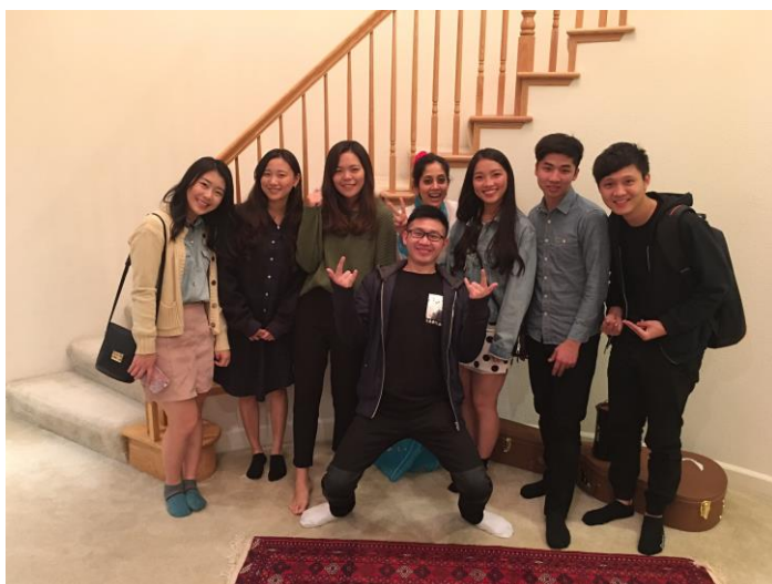
感恩節去老師家慶祝