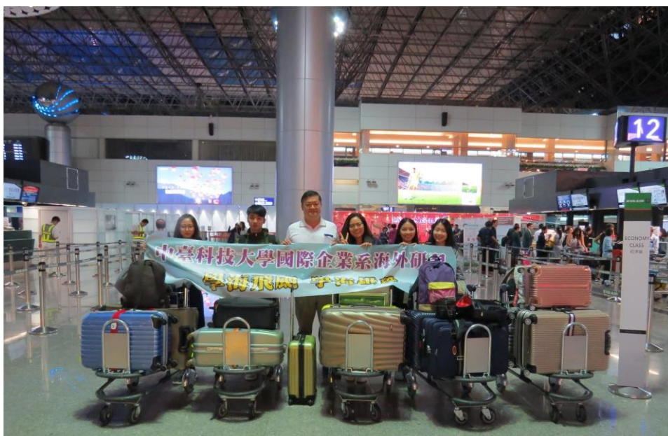
出發前在桃園機場與老師及同學們合影

透過教育部的學海飛颺計畫，讓我有機會可以去美國交換學生四個月，這四個月也讓我成長了許多。在桃園機場即將出發去美國，在飛機上度過了漫長的時間，到了美國舊金山機場，像是劉姥姥進大觀園，一切都覺得太不可思議了。