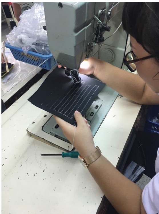
(給實習生實際操作針車)