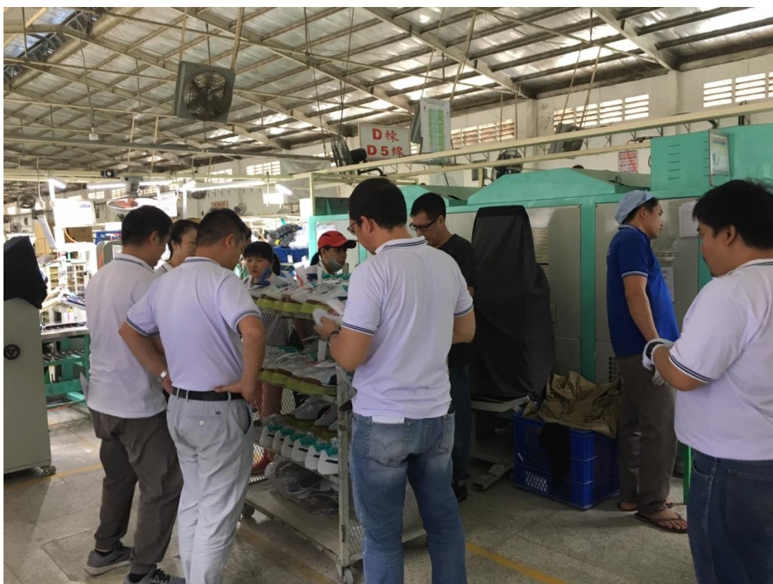
(PUMA 工程師到現場查看有無問題)