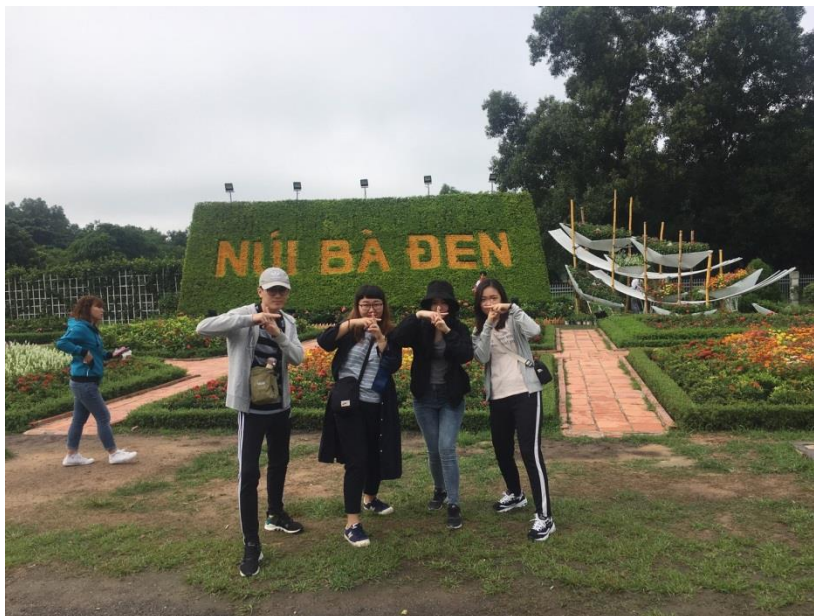
(西寧黑婆山 山下一隅)