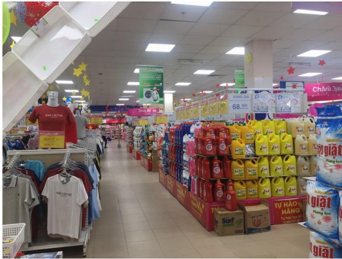
(COOP MART 超市一景)

後來他已經變成我們每周必去補貨的地方。在第二週的假日公司舍監待我們包車到西寧非常有名的黑婆山，爬了約莫一小時半就會抵達寺廟，然後下山的部份我們搭乘纜車，從窗外看出，西寧的美景一覽無遺，真的是難忘的經驗。