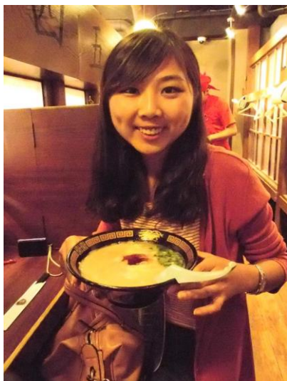
圖六 品嚐日本拉麵

日本的飲食也是一大學問，他們的餐廳大多都採自動的點餐方式，先從在機器點選自己喜歡的餐點再拿食券拿餐點，這點我覺得很新奇也很喜歡，這樣可以減少人力的成本，而且他們都會先在店門口有餐點的模型和價錢給你參考，我覺得這點台灣可以學習。日本人習慣吃飯一定會配冰水，因為口味偏鹹，冰水可以稀釋口中的味道。