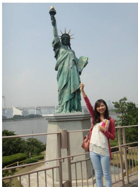
圖九 台場自由女神像