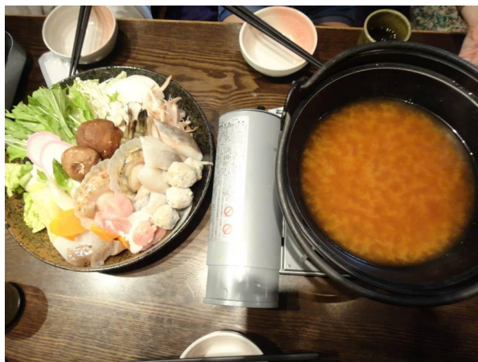
圖七 日本有名的相撲鍋

假日我們會安排出去遊玩的時間和地點，這次在日本待了一個半月，我們也走遍不少地方，千葉、池袋、新宿、上野、原宿，淺草、台場等等。