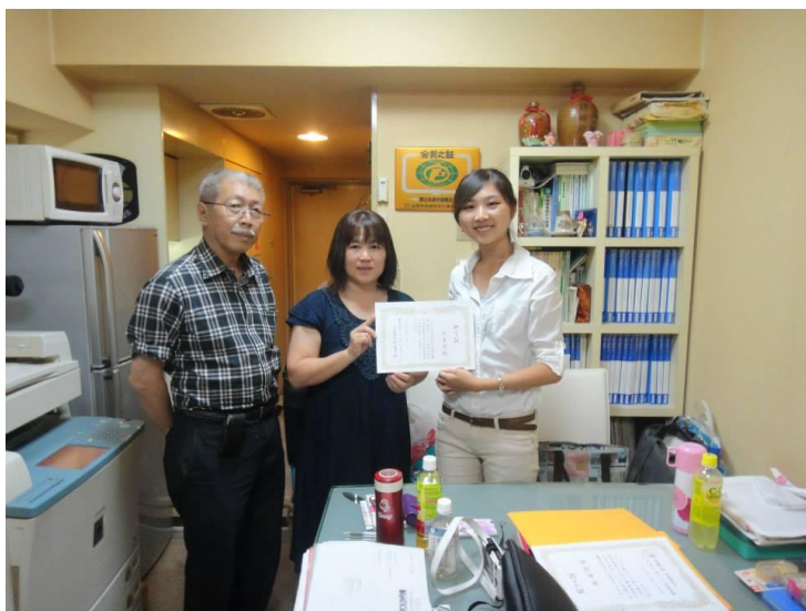
圖十六 研修完成，公司頒發給我們研修證書。