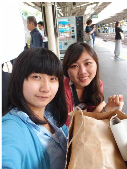
圖四 第一次送文件出任務成功

我們參與到公司的夏日員工旅遊，我們到逗子的海邊。當天是太陽高照的好天氣，會長說努力工作固然重要但是適當的休息可以讓腦子的思緒休息和身體放鬆，當一個人拚命埋頭苦幹在工作中是無法激發出想像力的。而且社長還跟我們說，日本人在夏天習慣一定要到海邊把皮膚曬的黝黑才代表人生過的快樂，所以我們在沙灘上看到很多人趴在地方曬日光浴，覺得很特別也是個很美好的回憶。