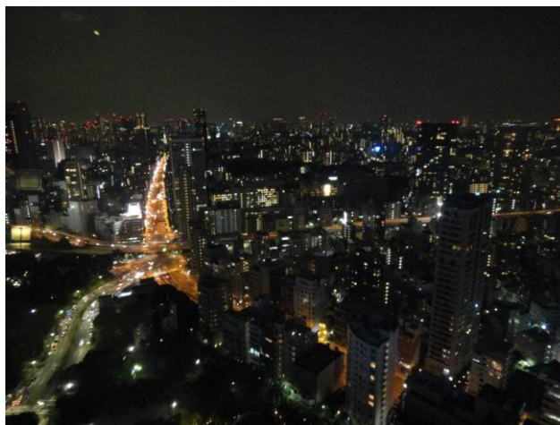
圖十五 我們到東京鐵塔觀景台看夜景