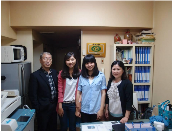
圖一 第一天進公司與社長會長合影

上班的工作有分類黏貼領收書（類似台灣的發票）、計算會計金額、查關於不動產的資料等等，每天的工作內容都不一樣，工作內容雖然簡單易上手，但是因為在異鄉加上語言隔閡，所以在聽交代工作時，心理還是會怕自己聽錯然後做錯，然後漸漸的熟悉工作環境，做好每一件交代好的事情，被社長和會長稱讚心理的成就感是榮譽的。