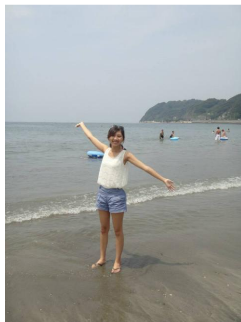
圖五 參與公司員工旅遊

在日本實習的這段期間，社長跟我們說了一個0和100的道理，他說做事沒有60分或是99分，只有沒有完成的0分和完成的100分，做事的把握度就是一樣。做任何事情都是要有十足的把握和信心，不能抱持著只要馬虎完成它就好心態。以前的我常常會抱持著這種心態，想說反正只要完成它就好沒做到100分的程度也沒關係，所以常常最有錯誤在裡面，聽到社長跟我們講訴的這個道理之後，我反省我自己，把這個道理謹記在心裡，改掉壞習慣。