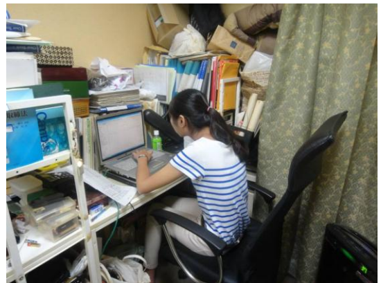
圖二、三 實習工作情形

記得實習的第一個禮拜，社長要我們搭日本JR電車幫忙送文件，剛到日本人生地不熟，這個任務很有挑戰性，社長只告訴我們如何搭乘但是其他遇到的困難，他希望我們可以靠自己的力量去解決，這樣才會快速進步和成長，沿途我們問路人靠自己的力量到達目的地時，親手把文件交給對方，心理的那種愉悅的心情是無法言喻的。