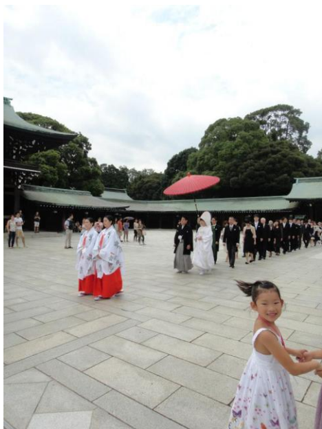
圖十 日本傳統婚禮

最讓我印象深刻的是到原宿的明治神宮，那天剛好遇到有新人在結婚，日本在神社結婚方式很特別，安靜且莊重，很幸運的遇到三對新人，見識到日本傳統婚禮，大開眼界。