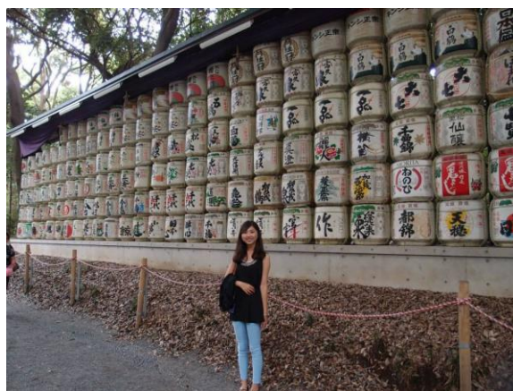
圖十一 到明治神宮遊玩

我們到千葉舞濱的東京迪士尼，從早開園玩到晚上閉園，迪士尼是大朋友小朋友的夢想之地，走進園區就像奏進童話故事裡面一樣，大家的臉上有洋溢著幸福的笑容，今年剛好是迪士尼的30周年，早上遊行和晚上遊行特別精彩，玩到不亦樂乎。