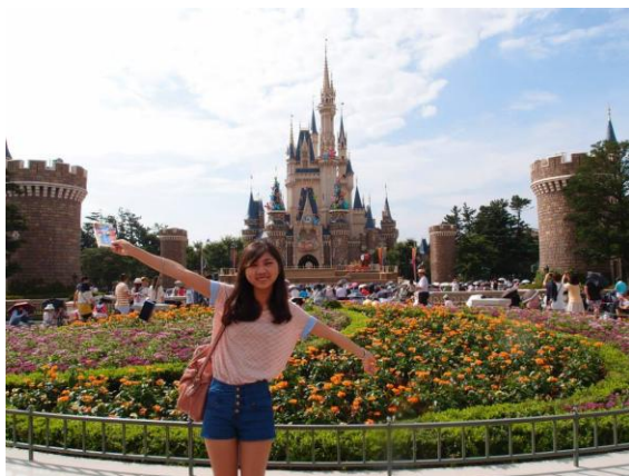
圖十二 東京迪士尼

我們到千葉舞濱的東京迪士尼，從早開園玩到晚上閉園，迪士尼是大朋友小朋友的夢想之地，走進園區就像奏進童話故事裡面一樣，大家的臉上有洋溢著幸福的笑容，今年剛好是迪士尼的30周年，早上遊行和晚上遊行特別精彩，玩到不亦樂乎。