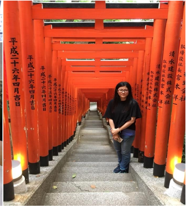
圖四、參觀日枝神社