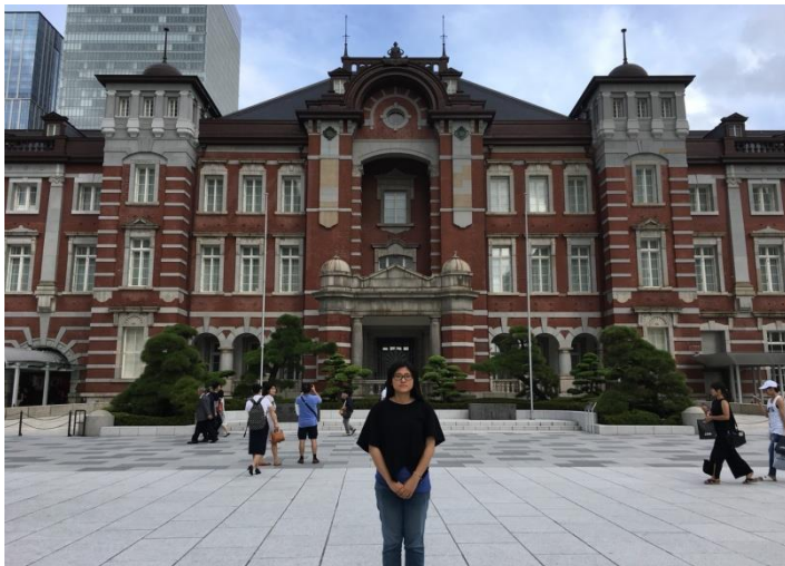
圖五、造訪東京車站