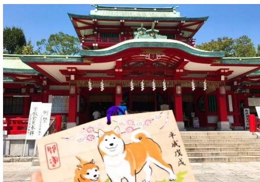
圖九 富岡八幡宮與繪馬