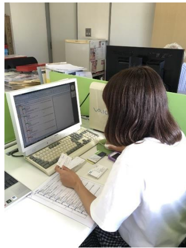
圖五 實習工作情形

在工作當中最特別的就是社長帶我們去參觀健康展覽會，在展覽會上見識到各式各樣的健身器材、健康食品等等，這裡也湧入了全日本的廠商與來自各國的廠商，這一天的展覽不僅讓我大開眼界也讓我了解到日本廠商與客戶之間的互動。