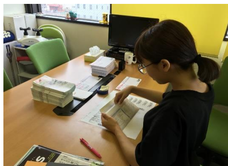
圖三 實習工作情形