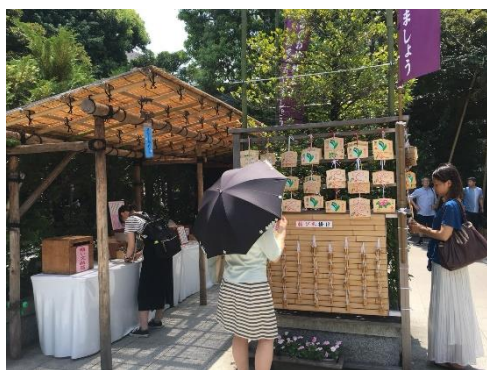
圖十 東京大神宮許願處