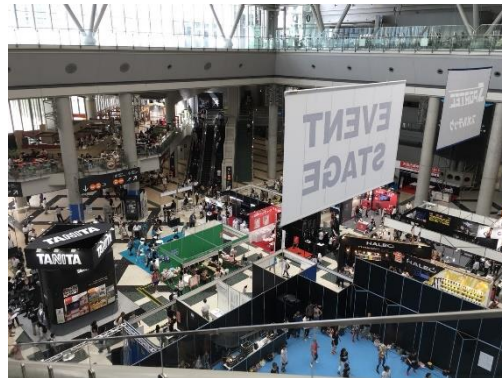
圖七 健康展覽會場