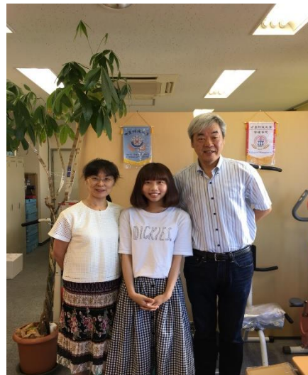
圖十六 與社長、會計小姐的合影