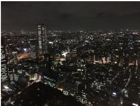
圖十二 從東京鐵塔拍的晚上

也去了日本知名地標東京鐵塔跟晴空塔，俯看一整個東京，還能看到台場的彩虹橋，白天跟晚上看感覺又不太一樣，各有其中的美；也走了一些日本的下町街道，感受日本懷舊的生活，品嚐傳統的點心，偶爾到下町走走享受不一樣的日本，也是很不錯呢！