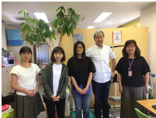
圖一 第一天進公司與社長、會計小姐合影

去理解產品的內容跟使用方法並且去使用那些運動器材，剛開始看到滿滿日文的說明書，讓我很擔心自己理解不了，但後來發現其實認真去看，不懂的字馬上用手機查詢意思並且寫下來加深自己印象，漸漸地都能理解裡頭的內容也學習到很多新的字彙。