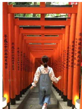
圖十一 日枝神社鳥居