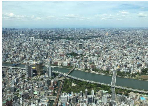
圖十三從晴空塔拍的早上

更去了日本東京迪士尼，從早開園玩到晚上閉園，迪士尼是所有大朋友與小朋友的夢想中的童話故事樂園，還能近距離與卡通人物互動，從早上的遊樂設施跟到晚上煙火與遊行，玩到不亦樂乎。