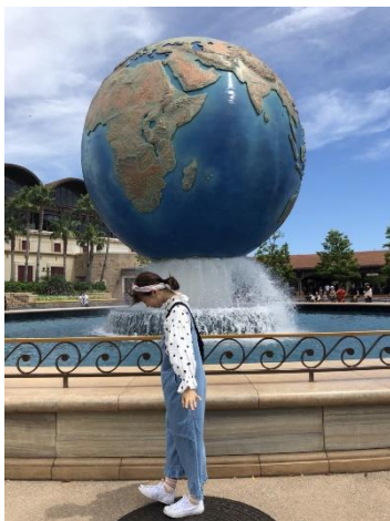
圖十三 迪士尼海樂園

更去了日本東京迪士尼，從早開園玩到晚上閉園，迪士尼是所有大朋友與小朋友的夢想中的童話故事樂園，還能近距離與卡通人物互動，從早上的遊樂設施跟到晚上煙火與遊行，玩到不亦樂乎。