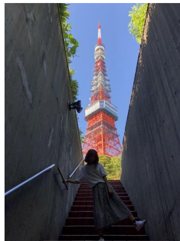
圖十四 日本東京鐵塔