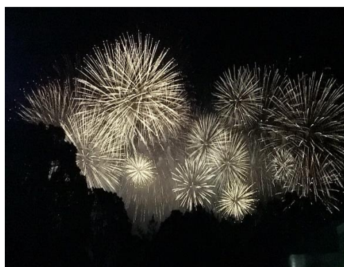
圖五 江戶川花火大會

最讓我印象深刻的就是日本的花火節了，這次我們是去「江戶川花火大會」，本來想去「隅田川花火大會」，但是剛好跟迪士尼同一天就沒去了，但是江戶川煙火也是很漂亮呢，在路途中看到很多日本人都穿著和服前往江戶川，看他們穿得那麼厚，我只能說日本人真的太強了，那天太陽很大，無法想像穿著和服是多麼的悶熱！