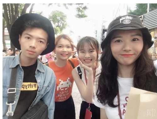
圖六 前往花火大會的合照

後來我們還去了迪士尼跟看晴空塔夜景，迪士尼實在是太多人了，才玩三四個設施就花費了幾乎整天，因為每個設施都要排隊半小時以上甚至更久，晚上的遊行雖然很特別但太短了，不到二十分鐘就沒了，本來城堡有燈光秀不知道為甚麼當天也沒看到，煙火也沒有，還蠻失望的，但是進去迪士尼的時候，我覺得迪士尼帶給你的氣氛就是很歡樂、和諧的感覺，還是值得一去的！晴空塔夜景也是我覺得很值得一去的地方，從高處往下看又是另一種美呢，建議在台灣的時候在網路上先買好，到日本再買會價差 400 塊台幣左右。